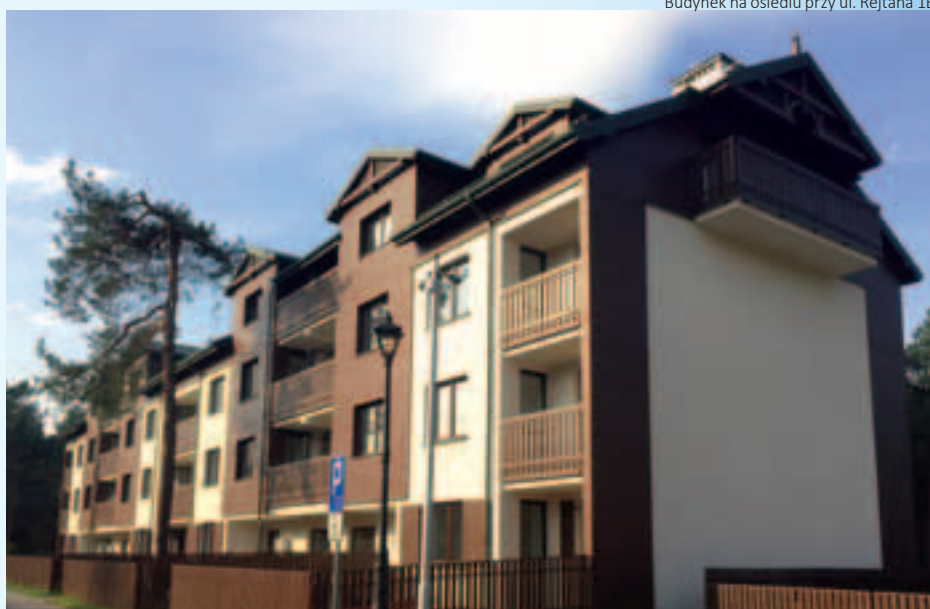
Budynek na osiedlu przy ul. Rejtana 5

Towarzystwo Budownictwa Społecznego w Józefowie Sp. z o.o. ul. Zielona 2, 05-420 Józefów, tel./fax 22-789-12-86, 22-789-21-44 www.tbsjozefow.pl, e-mail: tbs@tbsjozefow.pl