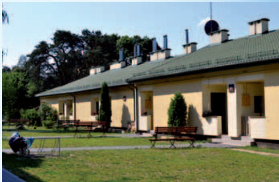
Budynek na osiedlu przy ul. Rejtana 3/5

Wychodząc naprzeciw temu zapotrzebowaniu spółka pracuje nad programem realizacji budowy lokali mieszkalnych w nowym systemie dla dobra społeczności lokalnej.