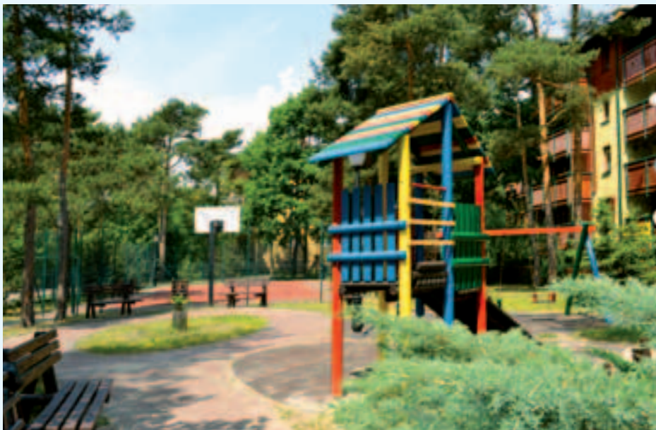
Plac zabaw na osiedlu przy ul. Zielonej 2A, 2B, 2C

we ogródki. W miejscu wyciętych drzew dokonano nowych nasadzeń drzew i krzewów. Najemcy lokali mieszkalnych posiadających przydomowe ogródki we własnym zakresie pięknie je zagospodarowali.