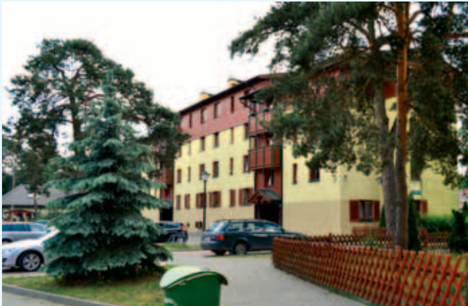
Budynki na osiedlu przy ul. Zielonej 2A, 2B, 2C