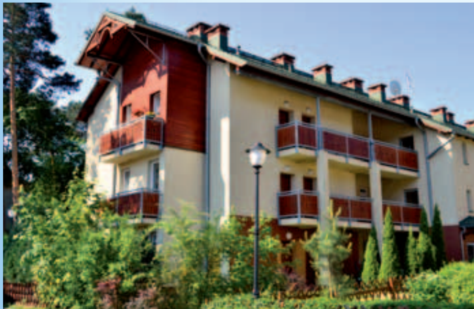
Budynki na osiedlu przy ul. Zawiszy 24, 26, 28