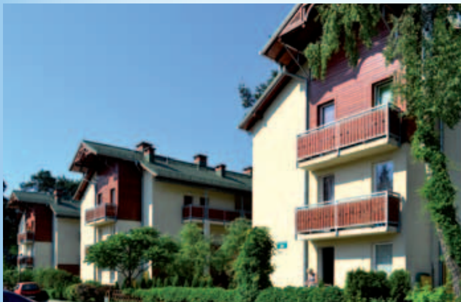
Budynki na osiedlu przy ul. Zawiszy 24, 26, 28

► budynków wielorodzinnych (30 lokali w każdym), przy finansowym wsparciu Banku Gospodarstwa Krajowego.