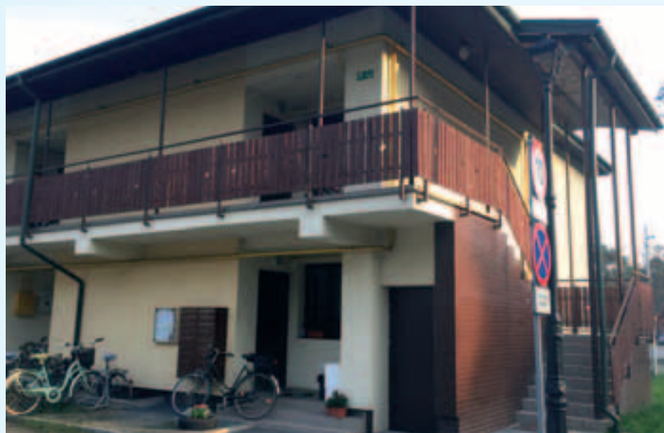
Budynek na osiedlu przy ul. Rejtana 1A