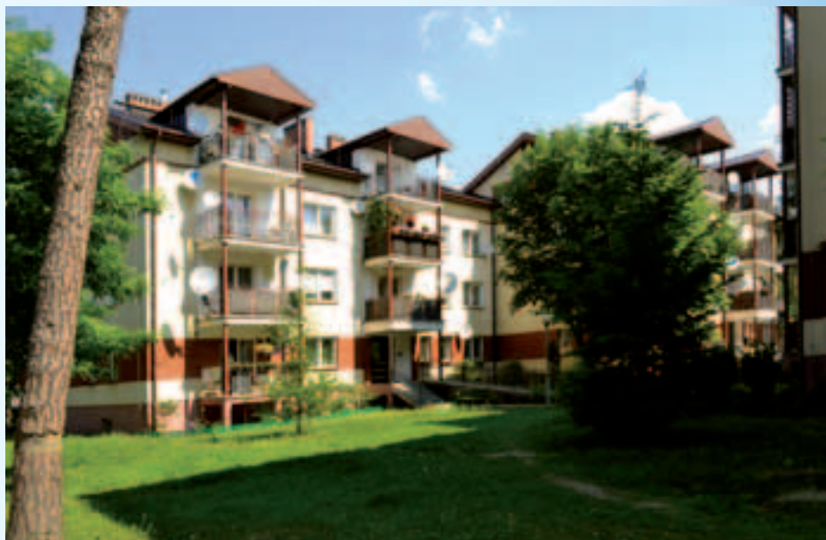
Budynki na osiedlu przy ul. 3 Maja 98 i 98A

Mieszkania wybudowane w ramach systemu budownictwa TBS to pełnowartościowe, energooszczędne lokale o relatywnie niskim czynszu. Misją TBWS jest realizacja miejskiej polityki mieszkaniowej przy zapewnieniu trwałości ekonomicznej spółki i wysokiej jakości obsługi klientów.