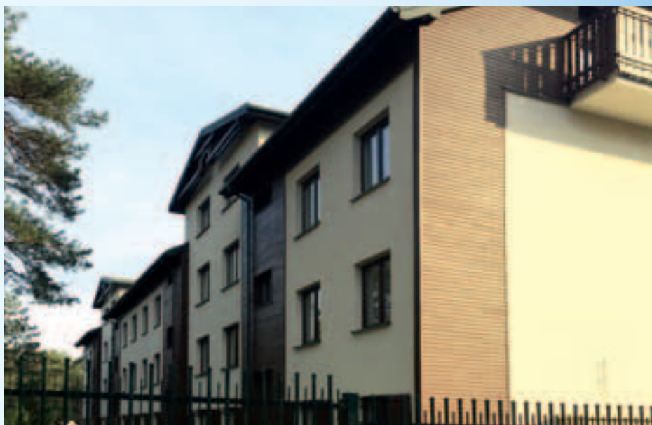
Budynek na osiedlu przy ul. Rejtana 1B